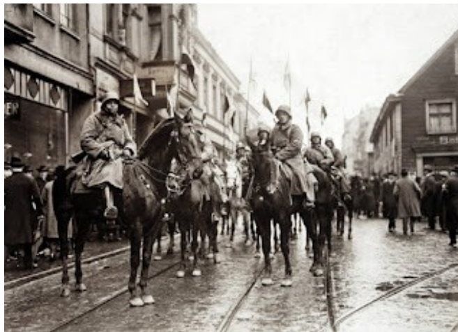
Abb. 1: Dragoner des Freikorps Lichtschlag auf der Bottroper Hochstraße, 23. Februar 1919

Etliche Gefangene wurden als Geiseln unter ständigen Bedrohungen, wobei einige besonnene Bewacher Schlimmeres verhinderten, in das Mülheimer Gefängnis verbracht. 45 Nachdem das Freikorps Lichtschlag wenige Tage später schließlich nach Bottrop vorgerückt war, wurden die Geiseln von einer Abordnung der Gemeinde mit einem Lastkraftwagen der Bottroper Luggesmühle zurück geholt. 46 Die Täter des Verbrechens auf dem Rathausplatz konnten derweil unbehelligt in der Masse der Angreifer untertauchen, von denen die meisten sich nach dreitägigem Intermezzo im Bottroper Rathaus vor den heranrückenden Regierungstruppen schleunigst in Sicherheit gebracht hatten. Die Gemeinde wurde am 23. Februar weisungsgemäß durch Truppen des Freikorps Lichtschlag besetzt. Die Besetzung erfolgte ohne nennenswerte Gegenwehr, ein Vortrupp von je sechs Offizieren und Meldereitern entwaffnete eine im Rathaus versammelte Gruppe von etwa 30 Radikalen, ehe diese zu ihren Waffen greifen konnten, und die meisten der noch in der Gemeinde anwesenden Aufrührer flohen in Richtung Sterkrade, 47 während die Bottroper Spartakisten und Unabhängigen jeglichen Widerstand aufgaben.